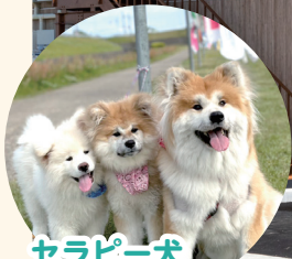
セラピー犬 ふふ・けありー・こころ