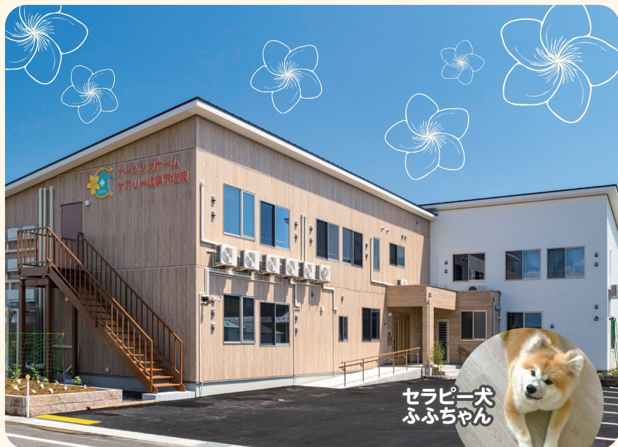
セラピー犬 ふふちゃん